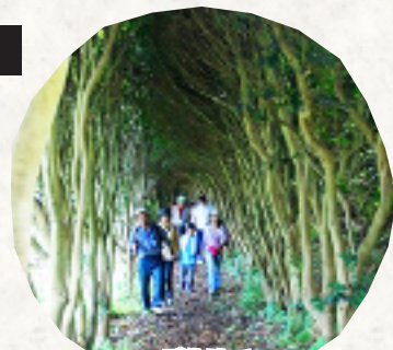
群生地 フィールドワーク

※このチラシの内容は平成27年8月現在の情報です。当日までに変更になる場合があります。予めご了承ください。